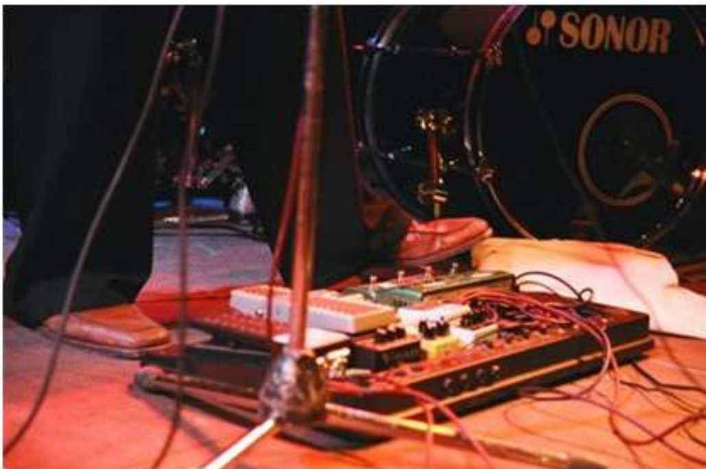
Els pedals d'en Llibert Fortuny a l'atac de 2004